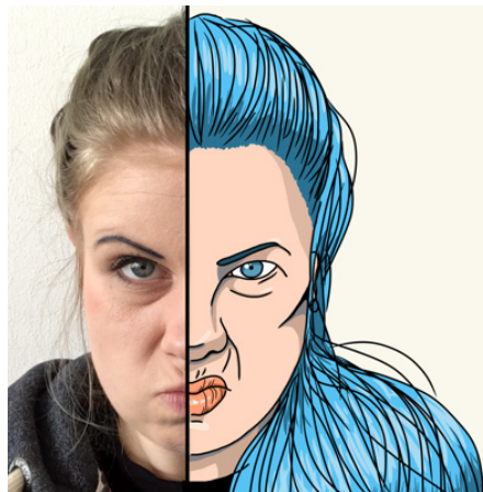
Kuvat & piirrokset: Neo Narjus